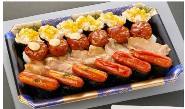
「おもいのまま寿司」のイメージ。サイズやネタが異なる 6 商品を販売予定。